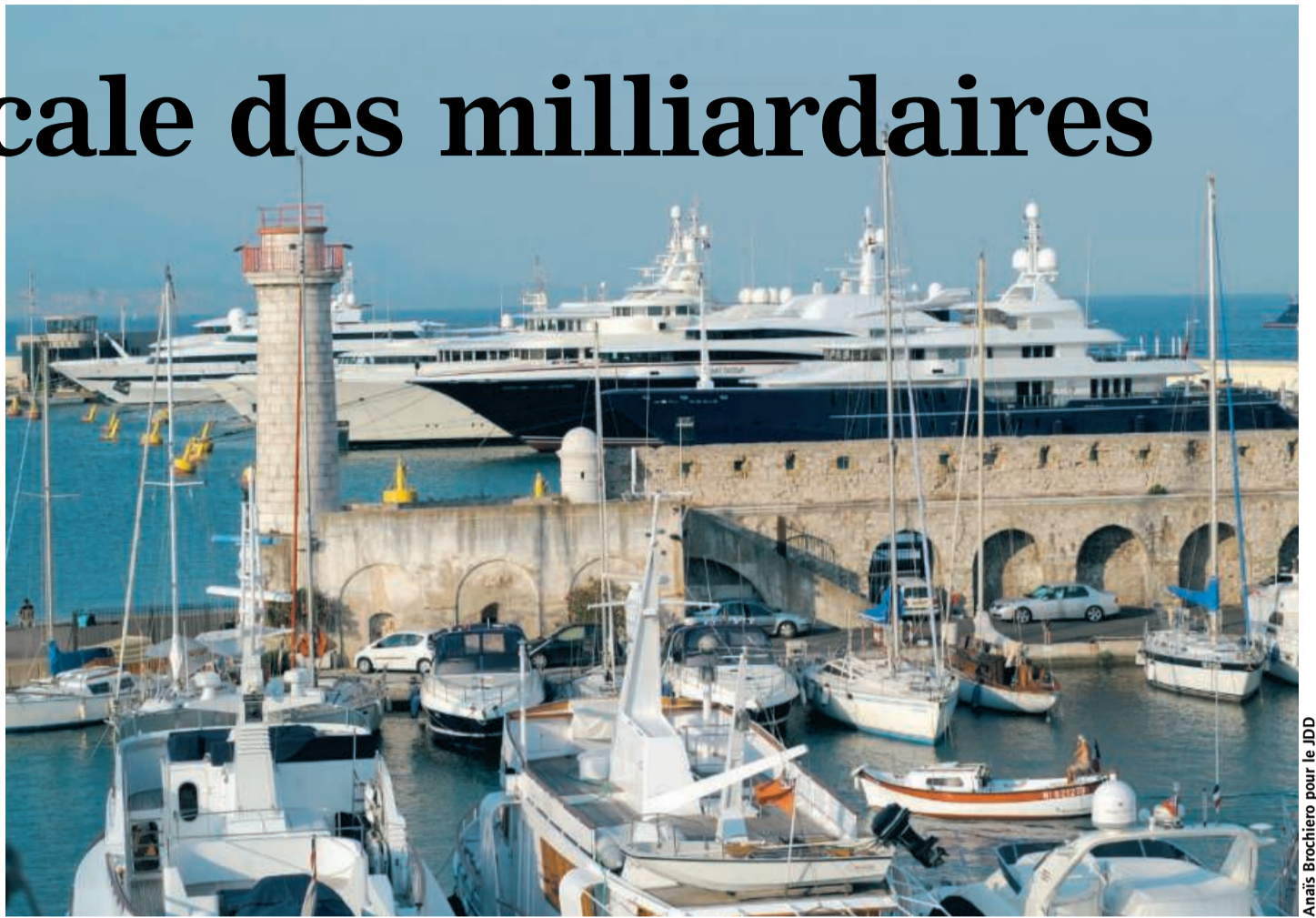
Sur le port d'Antibes, la semaine dernière. Protégé par une digue de 600 m, c'est le seul en France capable d'accueillir 19 navires géants, longs de 70 à 150 mètres.

A la fin de l'année, la ville lancera un projet d'extension du quai. « Il y a un vrai marché. Des yachts de 150 à 200 m sont actuel-